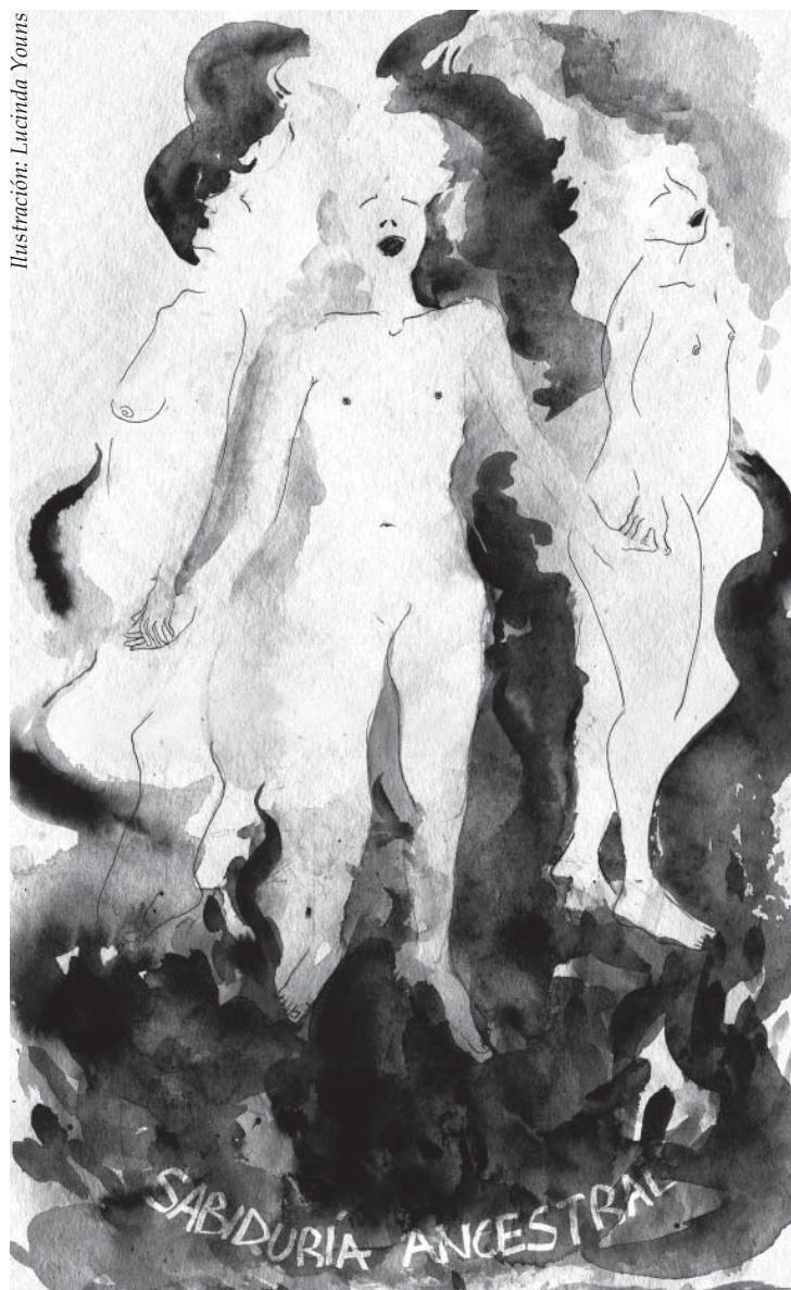
Ilustración: Lucinda Youns