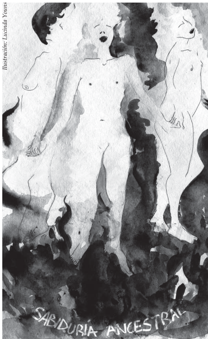
Ilustración: Lucinda Youns