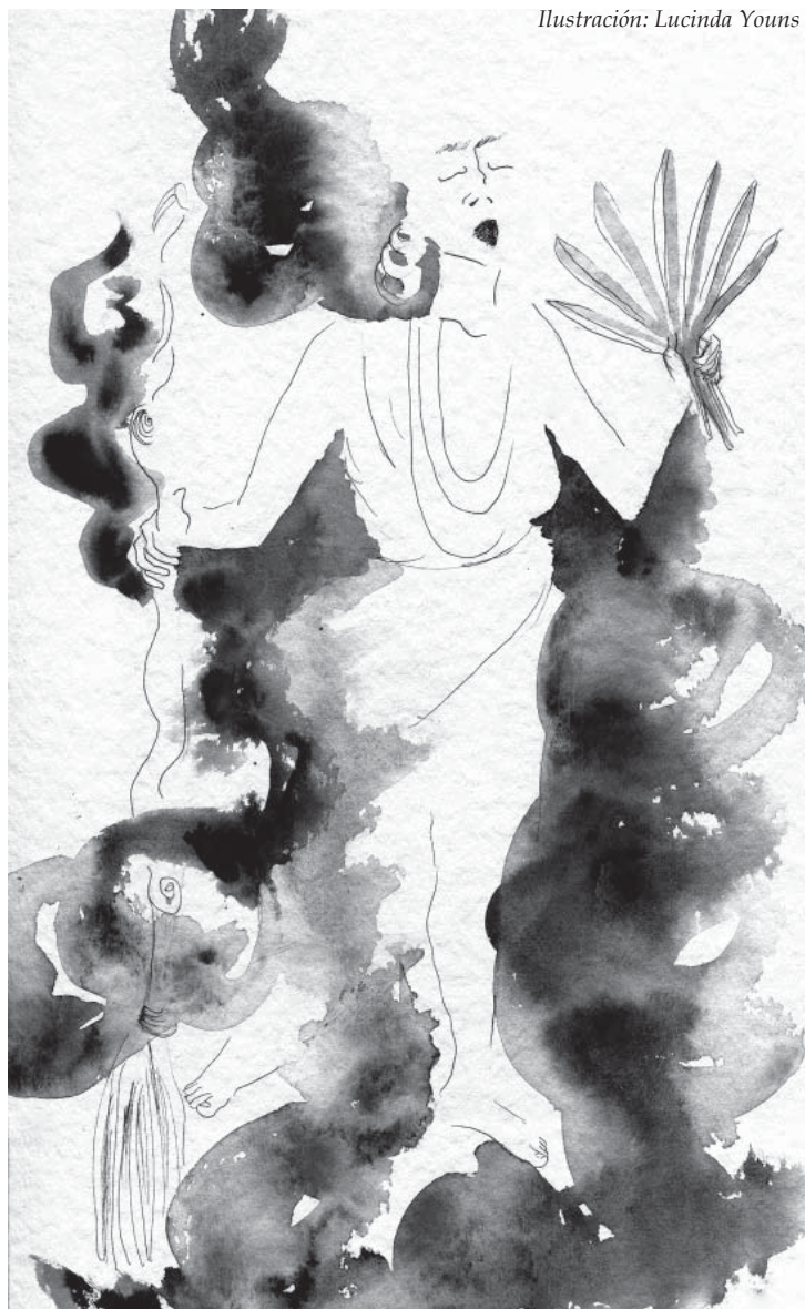
Ilustración: Lucinda Youns