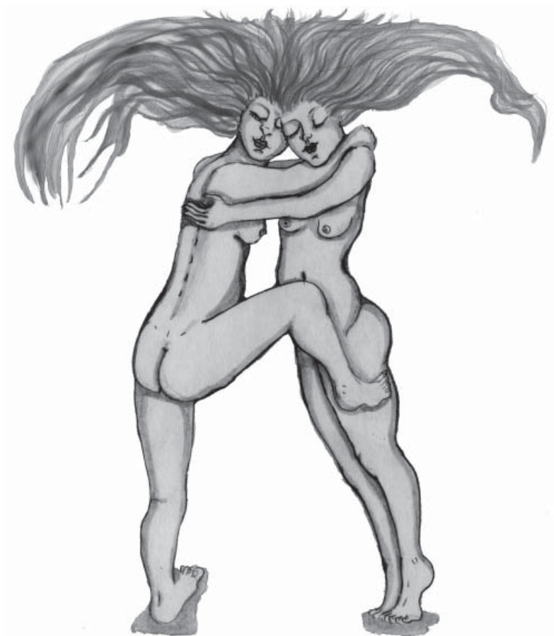
Ilustración: Myrna Mincoff