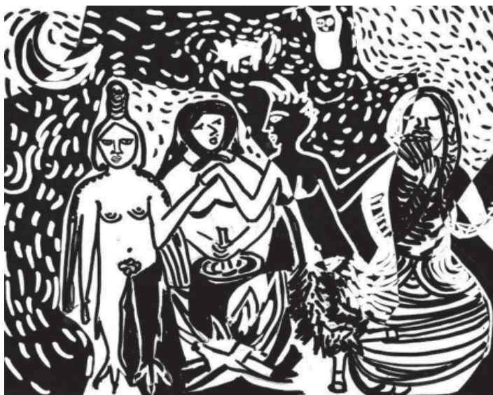
Ilustración: Luciana Campilongo