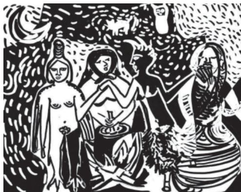
Ilustración: Luciana Campilongo

1 Este relato puede leerse en www.8300.com.ar