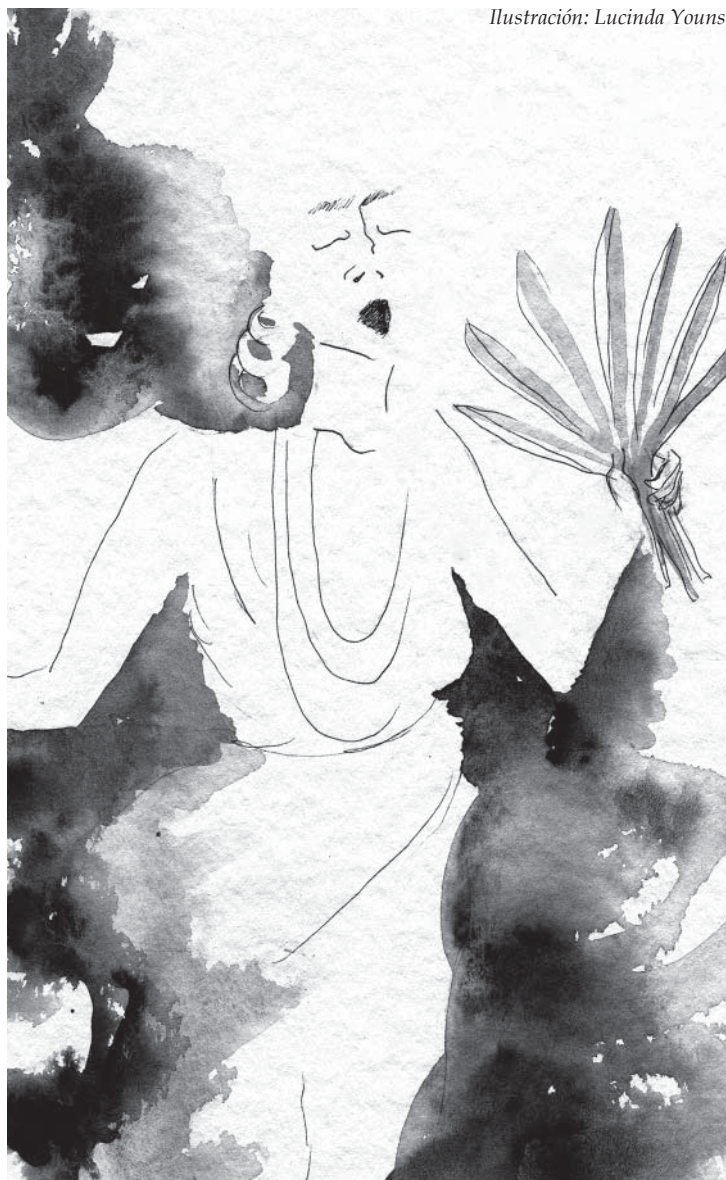
Ilustración: Lucinda Youns