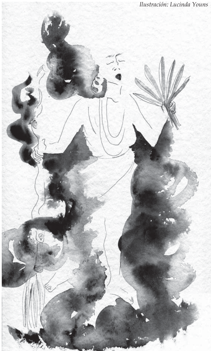
Ilustración: Lucinda Youns